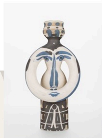
PABLO PICASSO Ceramiche 1948—1971