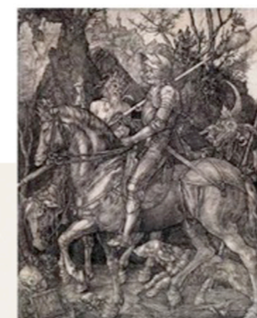
ALBRECHT DÜRER Il Cavaliere, la Morte e il Diavolo 1513