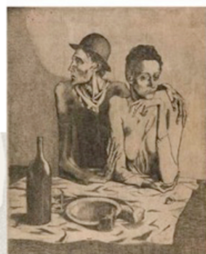
PABLO PICASSO Suite dei Saltimbanchi 1913