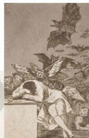
FRANCISCO GOYA I Capricci 1797/98