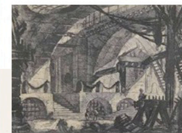
GIAMBATTISTA PIRANESI Carceri d'invenzione 1745/50