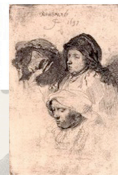
REMBRANDT VAN RIJN Tre volti di donna, una addormentata 1637